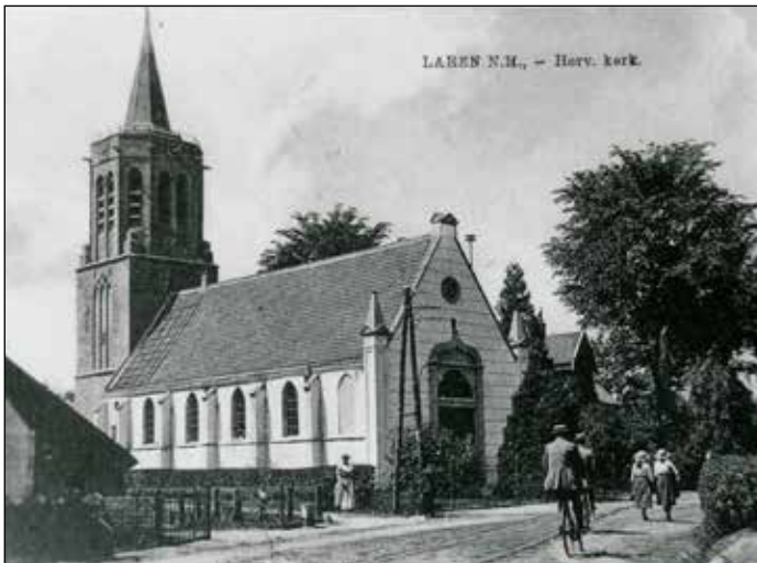
De kerk tussen 1844 en 1926. Foto na 1882.

In 1926 werd er aan de lange noordgevel een consistorie en een stookkelder bijgebouwd. Een in twee delen gezaagd bord achter in de kerk herinnert aan de restauratie van 1926.