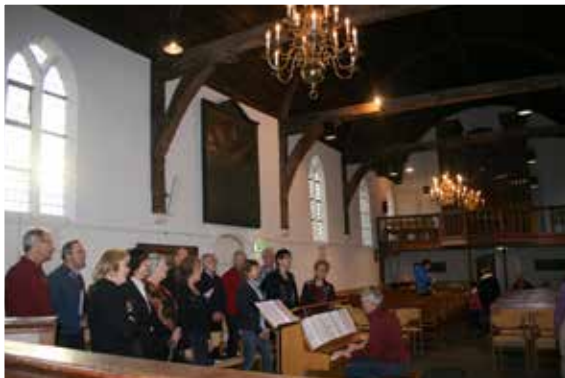
Repetitie van het kerkkoor.

In de Johanneskerk worden, naast de diensten in de zomervakantie, speciale diensten gehouden en maandelijks een Avondgebed en de Oecumenische Vesper. Verder zijn er trouw- en rouwdiensten en wordt de kerk regelmatig gebruikt voor lezingen en concerten. Daarnaast is de kerk in de zomermaanden open als stiltecentrum op zaterdagmiddag.