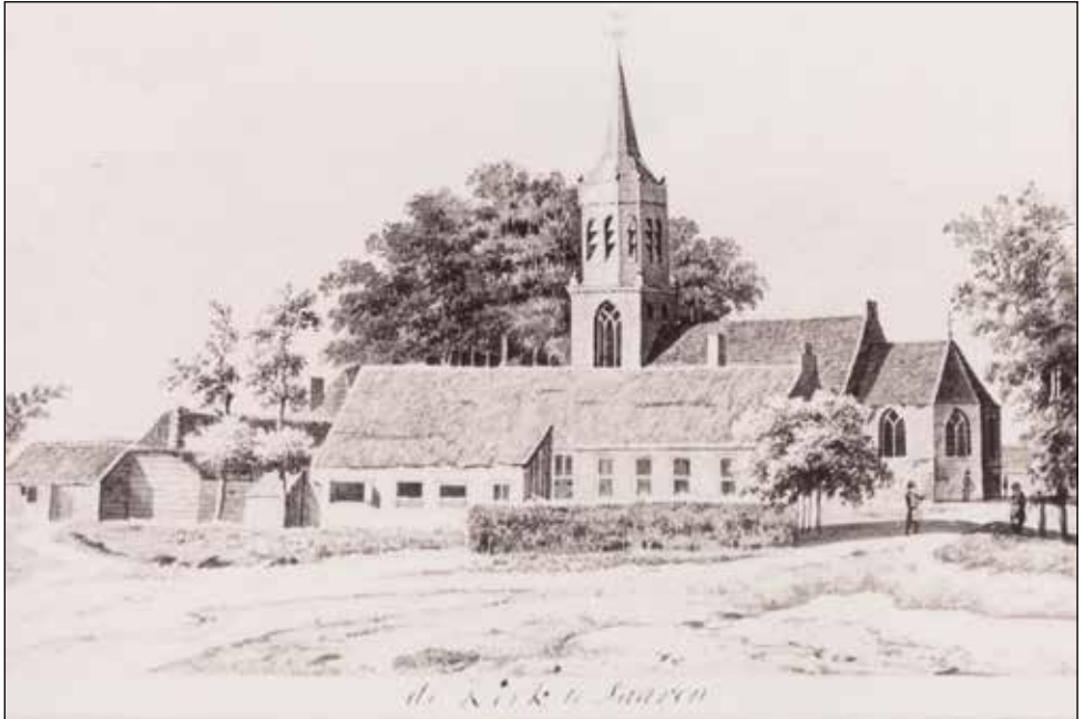
De Johanneskerk met omgeving op 18 e eeuwse prent.

Het laatste stuk is bekend uit de brieven van Hooft. Maar kennelijk heeft de schrijver in het dorp vernomen hoe de kerk wordt genoemd en dan blijkt men 200 jaar na de wijding toch nog de naam van Johannes de Doper aan de kerk te verbinden. Jammer genoeg is deze naam bij de Protestanten in onbruik geraakt.