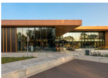
Huis van Eemnes