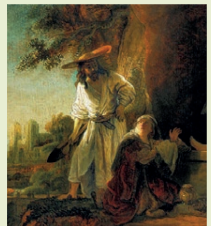
Rembrandt - De opgestane Heer verschijnt aan Maria Magdalena (1638) detail

Het gedicht wordt gekenmerkt door een herhaling van 'hovenier' aan het eind van elke strofe. In de laatste regel kantelt het gedicht: wat eerst een vergissing leek te zijn, wordt nu omgebogen tot een hoopvolle verwachting: Christus zal de hovenier van ons zijn, met ons in het paradijs zijn.