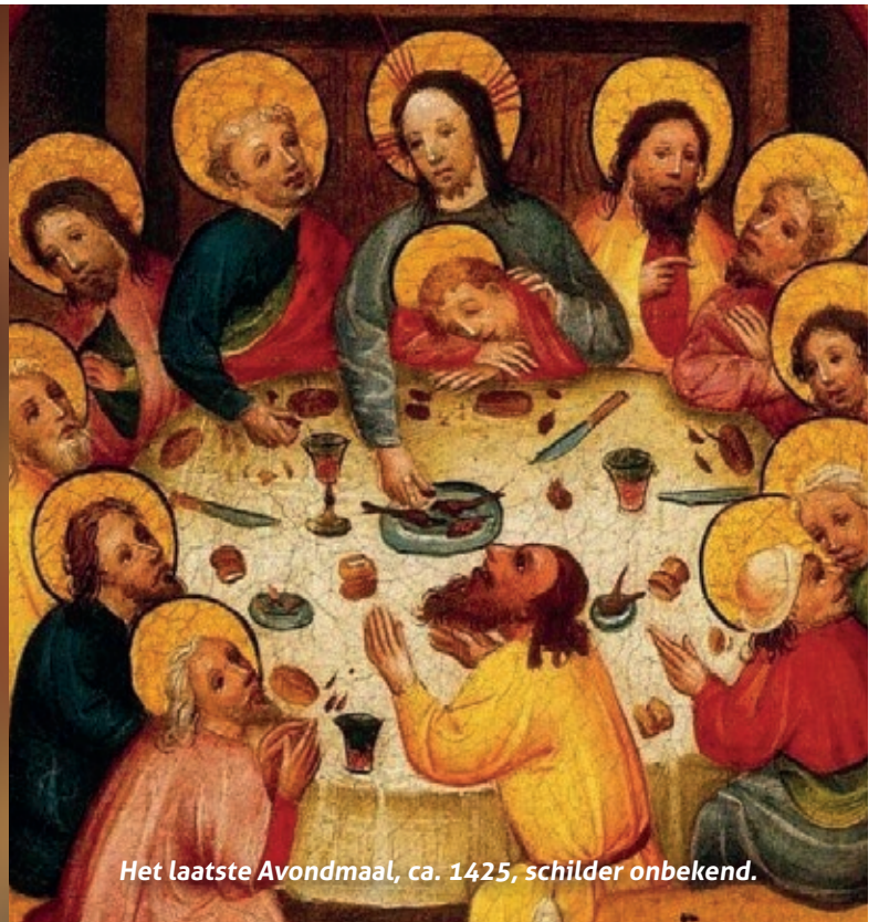
Het laatste Avondmaal, ca. 1425, schilder onbekend.

Aan de Tafel van de Heer ontmoeten wij elkaar in het licht van Christus. Hij zelf is als gastheer in ons midden. Dus telkens als wij de Maaltijd vieren, beleven wij een vreugdevol bewustwordingsmoment bij dit geheimenis. Er zijn in het jaar kerkdiensten met een profiel die als het ware vragen om zo'n viering. Ik denk aan de derde zondag van de Advent, aan Kanazondag, aan de eerste en de vierde zondagen van de Veertigdagen, aan Witte Donderdag, aan Zondag Trinitatis en aan Voleindingszondag. Niets moet, maar gaandeweg ontdekken wij het reliëf van het kerkelijk jaar en daardoor het reliëf van een echt leven.