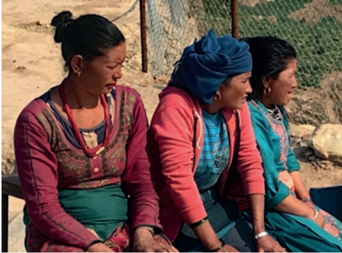
Vrouwen in Nepal