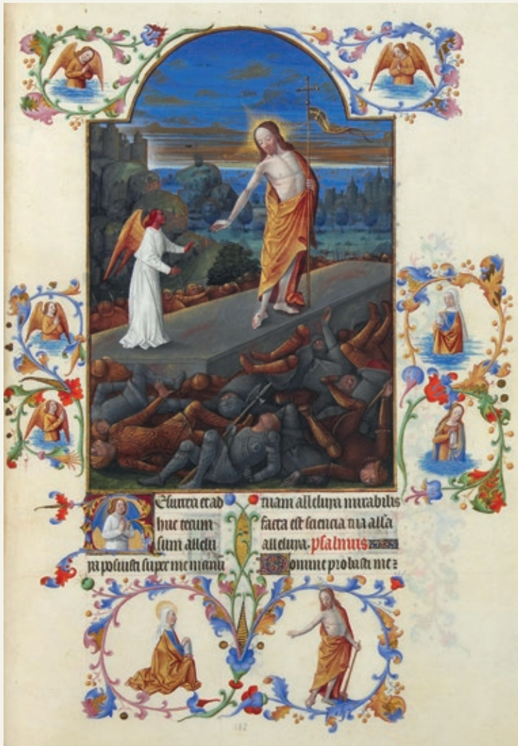
Chantilly, Musée Condé, MS 65, fol.182v Les Très Riches Heures van Hertog Jan van Berry, 1411-1416; 1485

Jean Colombe heeft, na de dood van de Gebroeders van Limburg in 1416, de illustratie van dit handschrift voltooid. Voor deze Paasminiatuur heeft hij zich de nodige vrijheden veroorloofd. Het graf is niet uitgehouwen in een rots, maar is een sarcofaag. Merkwaardig genoeg is die nog ongeopend, hoewel de opgestane Heer er al bovenop staat met het kruisbanier, het symbool van zijn verrijzenis, in zijn hand. Een cohort soldaten ligt om de sarcofaag heen te slapen. Deze miniatuur is een spel van licht en donker: Christus is met de engel een stralend middelpunt, terwijl het licht van de dageraad de rotsen links al doet oplichten, maar de stad rechts blijft nog in schemer gehuld.