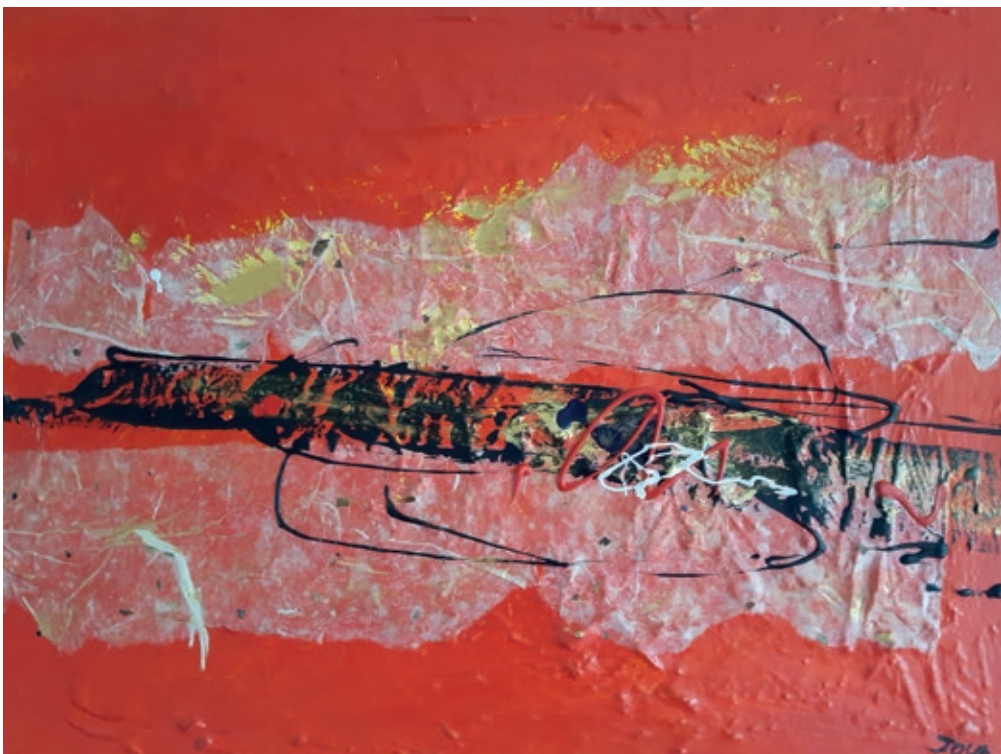
Okhie Joun – Zonder titel